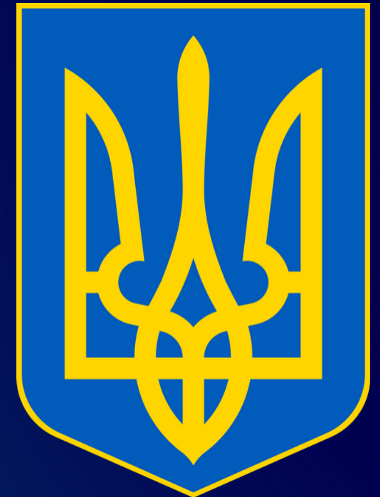
зу "ПРО ВИЩУ ОСВІТУ"