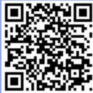
Сторінка кафедри на facebook