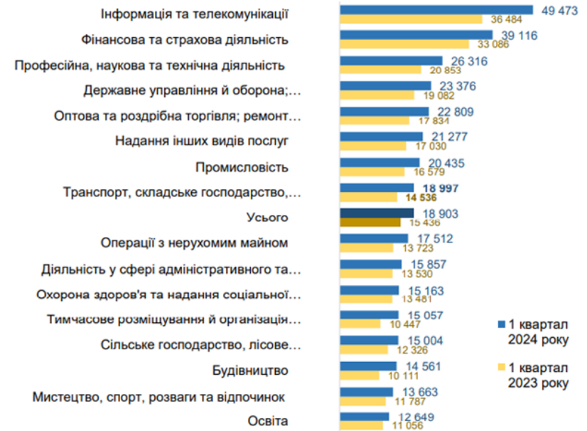
СЕРЕДНЬОМІСЯЧНА ЗАРОБІТНА ПЛАТА ШТАТНИХ ПРАЦІВНИКІВ ЗА ВИДАМИ ЕКОНОМІЧНОЇ ДІЯЛЬНОСТІ ЗА I КВАРТАЛ 2023 ТА 2024 РОКІВ, ГРИВЕНЬ*