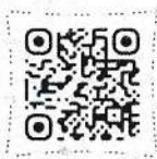
Перелік Освітніх центрів